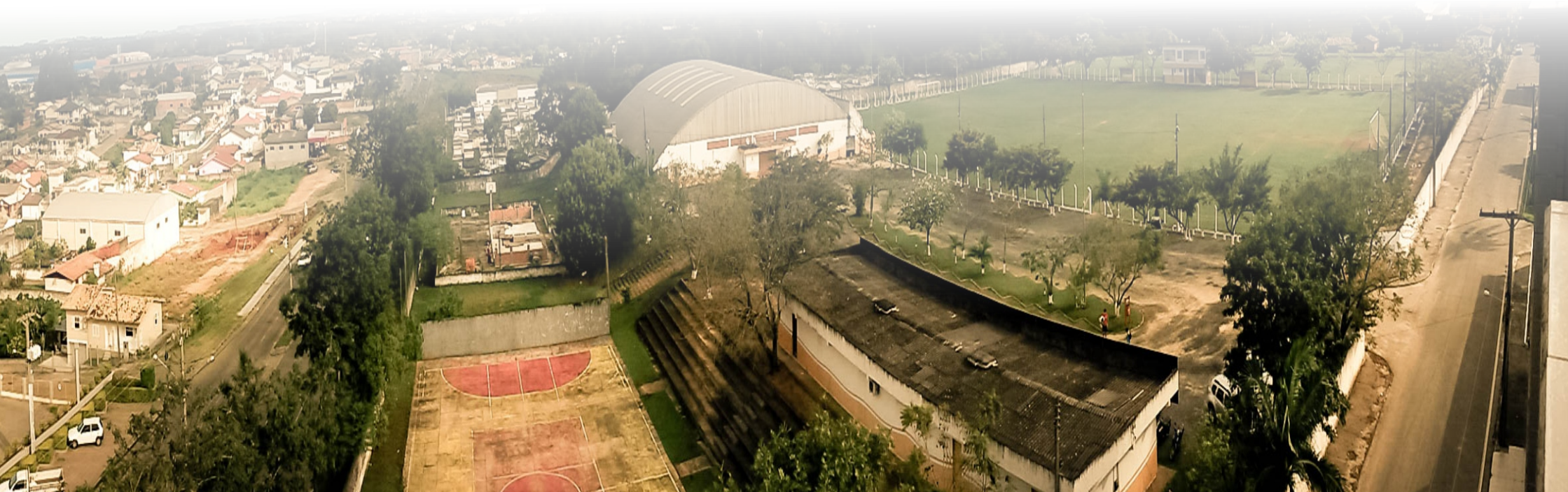
Imagem 02 Vista aérea do Complexo Esportivo.

A pesquisa teórica e de referências de projeto será o ponto de partida para a elaboração deste trabalho, buscando contribuir com a intervenção do local, a partir da qualificação de equipamento de esporte e lazer para integração dos moradores do município.